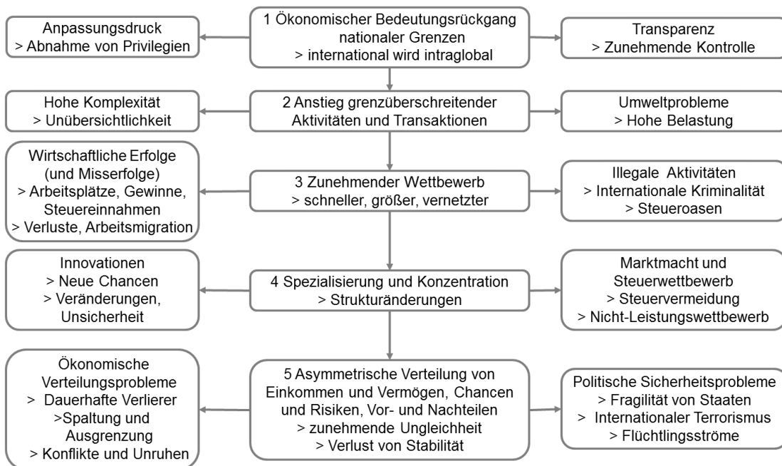
Abb. 2 Folgen der Globalisierung - Überblick © E. Koch

Neben der Produktion selbst sowie dem Konsum zu billig hergestellter Produkte verursachen die durch die Zunahme von Produktion und Konsum steigenden Transporte Umweltschäden auf dem Land, in der Luft und auf dem Wasser. Dies schließt alle Arten von kurz- und langfristigen Klimaschäden durch erhöhte Schadstoffbelastung genauso ein wie Infrastrukturschäden und Belastungen der Flora und Fauna. Erschwerend wirkt hierbei, dass in vielen Ländern die Transportpreise subventioniert werden, etwas durch Steuerbefreiungen, wie im Fall des Mehrwertsteuerbefreiten Kerosins, so dass die Nutzungsentgelte für die Inanspruchnahme der bestehenden Infrastruktur praktisch nie den tatsächlichen Kosten entsprechen („Transportkosten-Dumping“). Argumentiert wird, dass eine höhere Belastung der Transporte mit den Kosten für die Erhaltung der Infrastruktur und die Beseitigung von Umweltschäden diese verteuern und zu einer Bevorteilung der weniger transportkostenintensiven regionalen Produktion führen und damit Globalisierungsprozesse verlangsamen würde.